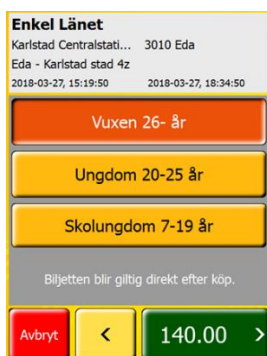
Val av ålderskategori.