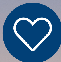
Vi bryr oss