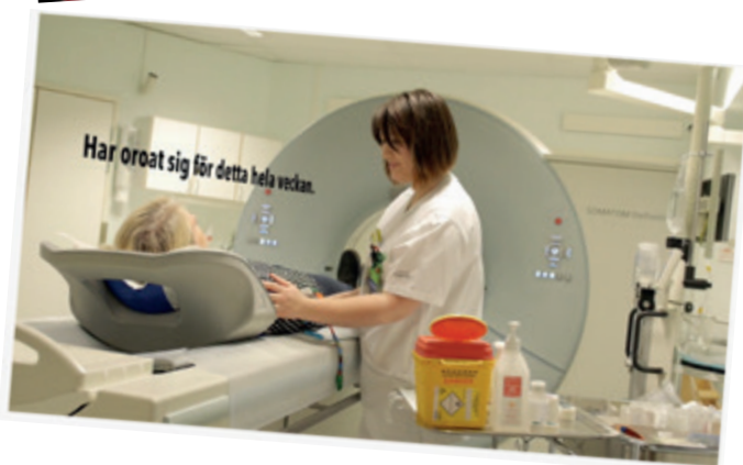
Bilder ur Region Kalmars film.