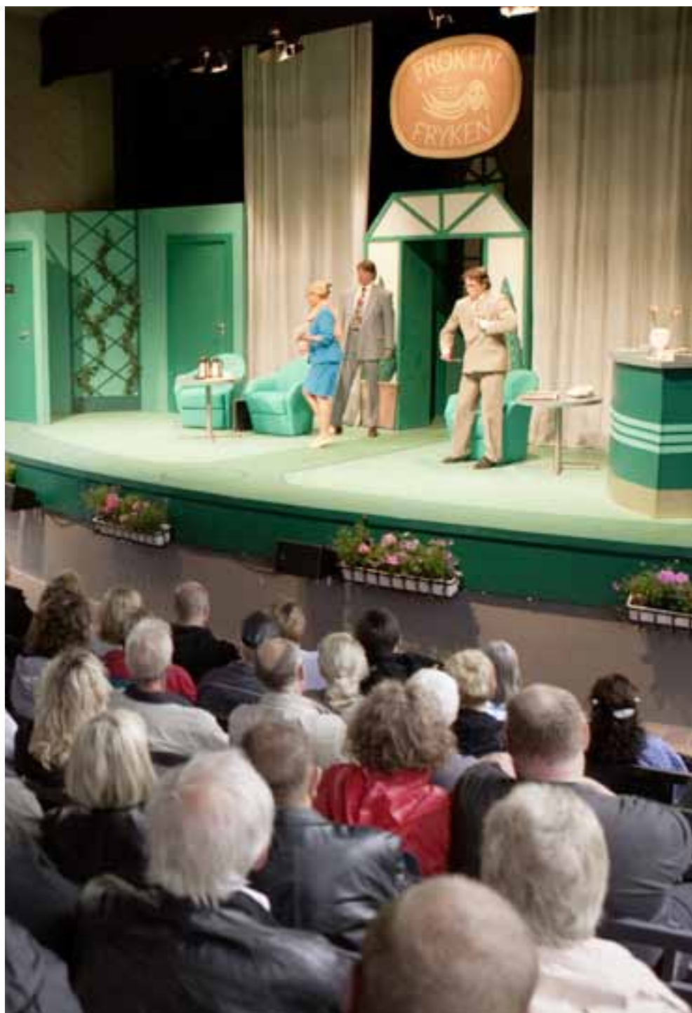
Sommarteater i Mariebergsskogen