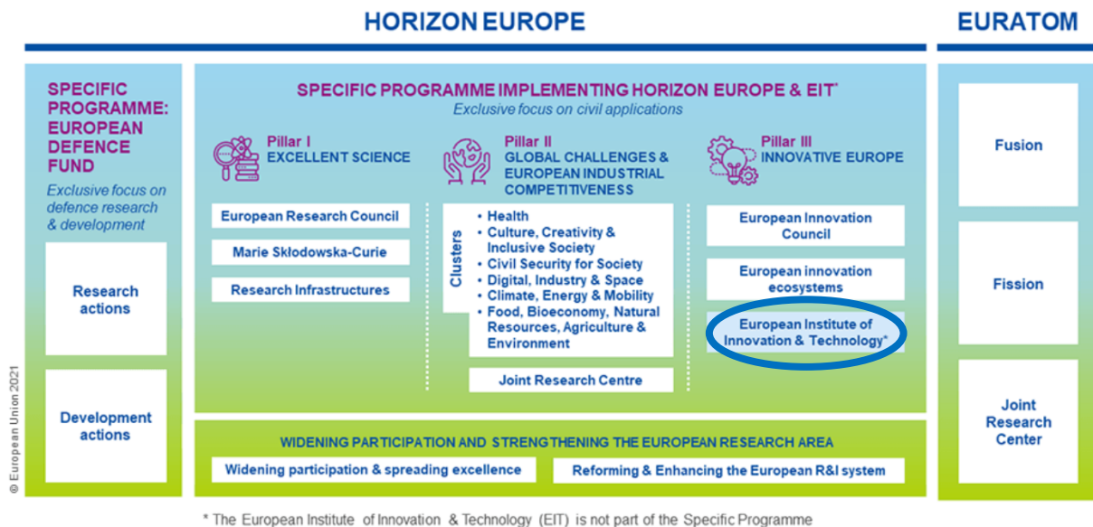
Figur 1: Strukturen av Horisont Europa

Europeiska Institutet för Innovation och Teknik grundades 2008 som ett oberoende forsknings- och innovationsorgan i EU. År 2014 organiserades EIT inom Horisont 2020, EU:s dåvarande ramprogram för forskning och innovation. I det nya ramprogrammet för 2021–2027, Horisont Europa, är EIT organiserad som del av programmets tredje pelare: "Innovativa Europa" och finansieras genom bidrag från Horisont Europa. Juridiskt är dock EIT en egen organisation som står utanför Horisont Europa där EIT:s strategiska agenda inte regleras genom Horisont Europa, utan genom en separat förordning. EIT:s agenda är dock menad att vara i linje med agendan för Horisont Europa. Urval av KI grupper regleras i förordning 294/2008 som etablerar EIT 1 .