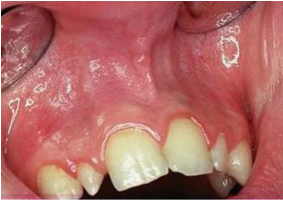
1 Grad 1 Ljusröda, fuktiga.