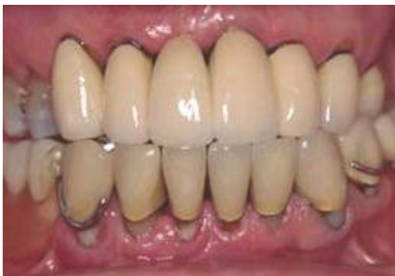
1 Grad 1 Ljusrött och fast.