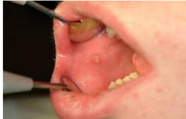
2 Grad 2 Röda, torra eller områden med färgförändringar eller beläggning.