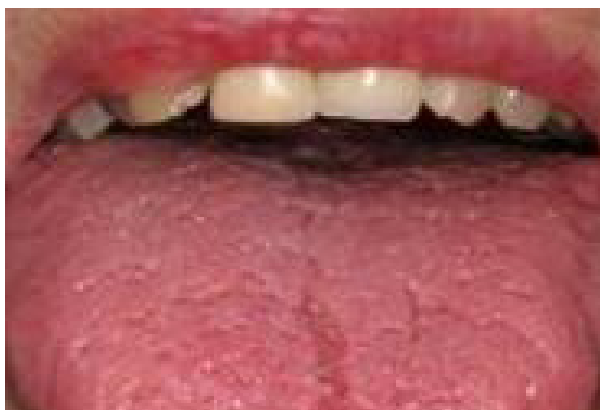
2 Grad 2 Inga papiller, röd, torr, beläggningar.