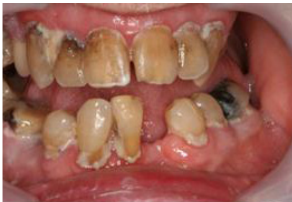
2 Grad 2 Svullet, rodnat.