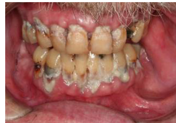
3 Grad 3 Beläggningar, matrester generellt eller trasiga tänder.