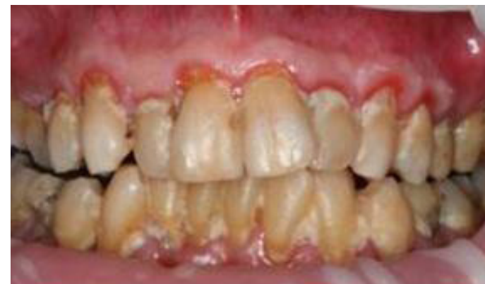
3 Grad 3 Spontan blödning.