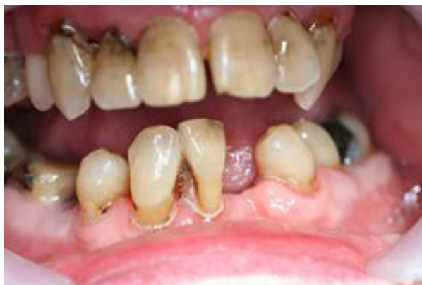
1 Grad 1 Rena, inga synliga beläggningar eller matrester.