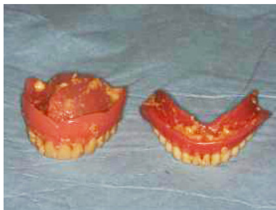
2 Grad 2 Beläggning eller matrester.