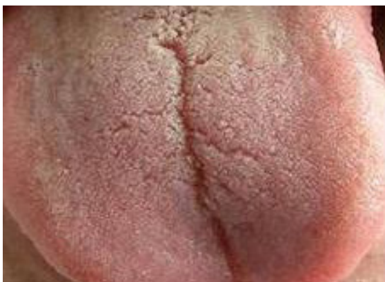
1 Grad 1 Ljusröd, fuktig med papiller.