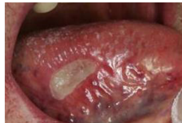
3 Grad 3 Sår med eller utan blödning, blåsor.