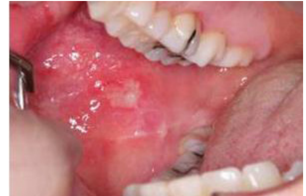
3 Grad 3 Sår med eller utan blödning, blåsor.