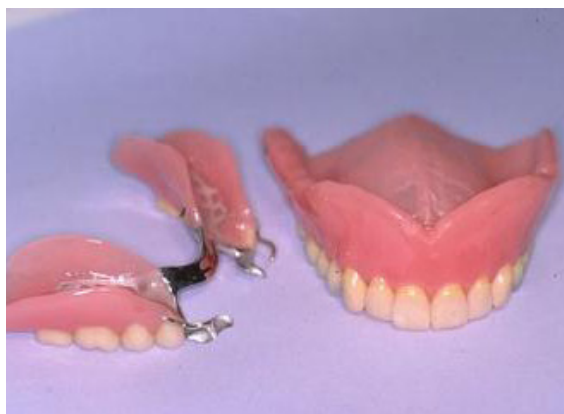
1 Grad 1 Ren och fungerande.