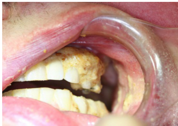
2 Grad 2 Beläggningar eller matrester lokalt.